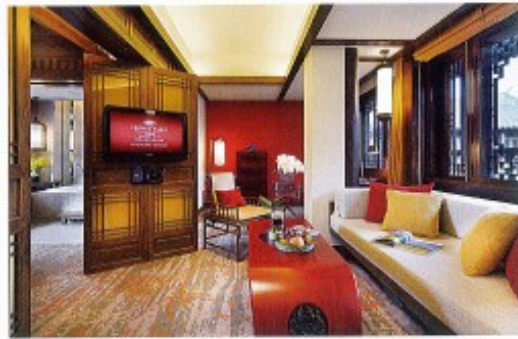
上：客房入口与流水 下左：与城市界面过渡的绿色缓冲 下右：客房室内 右页：自然融合的单壳体