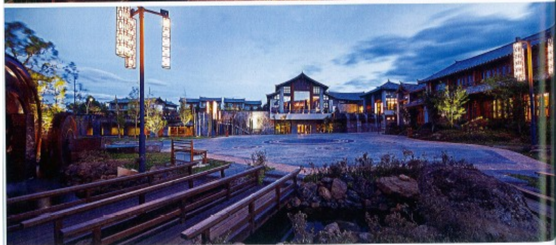
上：大堂 下：公共服务区夜景