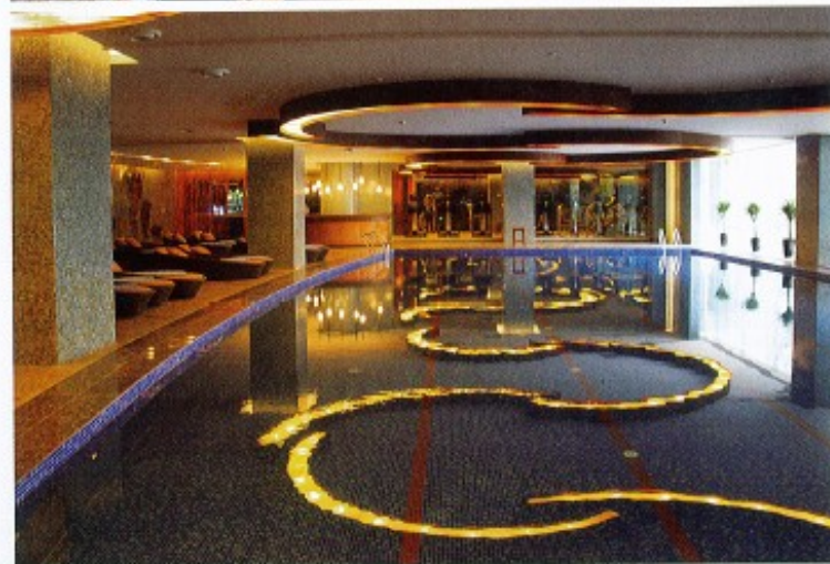
上: SPA区入口 中: 茶艺室内 下: 室内泳池