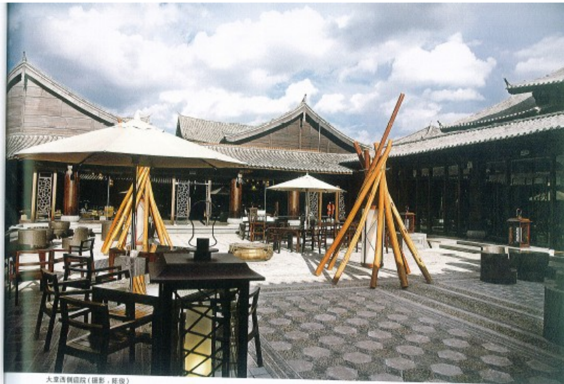
大堂休闲庭院